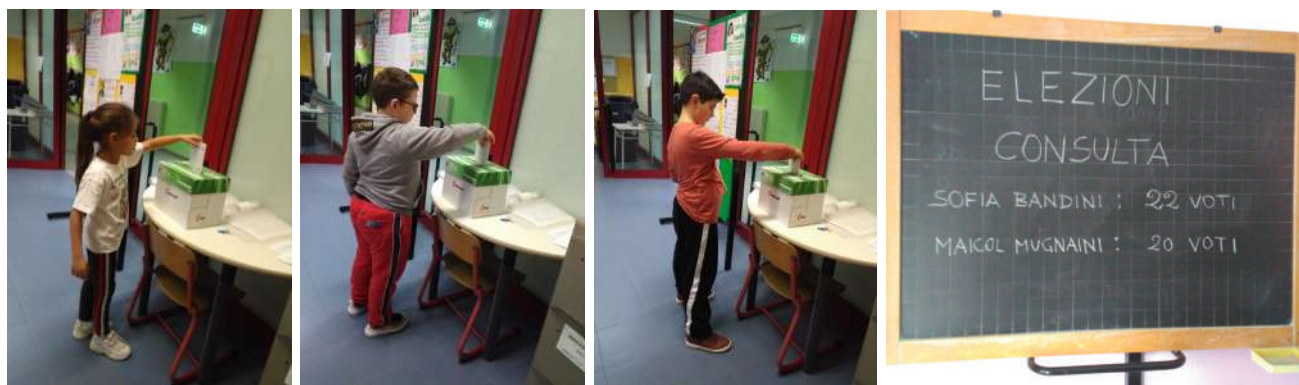
A sx. alcuni/e alunni/e della classe 4 a durante il momento della votazione, a dx. una lavagna con il risultato delle elezioni